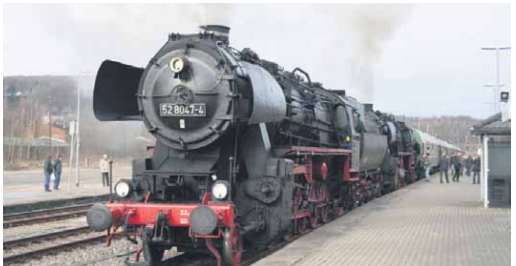
Die vereinseigene Dampflokomotive 528047-4 wird im kommenden Jahr zu zahlreichen Höhepunkten unterwegs sein.

am Gebäude einiges instandgesetzt werden. „Wir wollen die Rolltore und Fenster rekonstruieren“, so Rost. Außerdem muss ein Wechsel von Gleisschwellen vor dem Lokschuppen erfolgen.