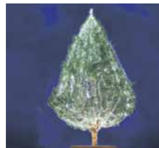
Ein Lichtschlauch setzt einen Weihnachtsbaum besonders in Szene

wunderschönen Sternenhimmel ins Heim. Lichterketten und Lichtschläuche schmücken Bäume im Garten und zeichnen romantisch die Konturen der Häuser nach. Weihnachtsmänner baumeln von den Fenstern, beleuchtete Schneemänner im Garten oder eine festliche Girlande an der Eingangstür sind ein netter Willkommensgruß.