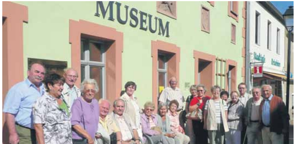
Zur Arbeit des Vereins gehören auch Exkursionen wie die ins Bad- und Stadtmuseum Bad Lausick.

ist der Vereinsvorstand optimistisch, auch künftig den einen oder anderen Geithainer der Generation „55 plus“ für diese Arbeit gewinnen zu können.