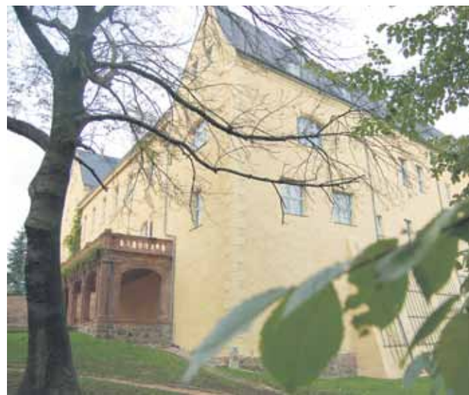
Erfolgreiches Jahr: Das Frohburger Schloss will künftig noch mehr Angebote für jugendliche Besucher bereit halten.

konnten die Dauerausstellungen zum Wirken Kurt Feuerriegels sowie die mit historischem Spielzeug komplett neu gestaltet, darüber hinaus neue Vitrinen und Beleuchtungssysteme angeschafft und der Kaminraum in einem völlig neuen Ambiente eingerichtet werden.