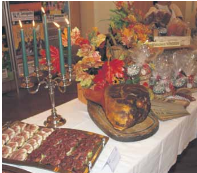
Einmal im Jahr lädt das Kulinarium zu einer Genussmesse ein.