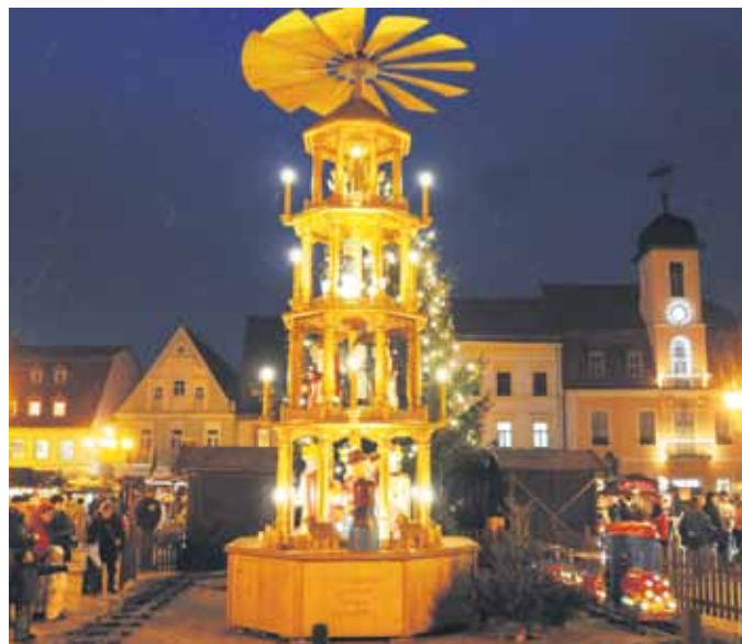
Blickfang auf dem Wurzener Weihnachtsmarkt: die große Pyramide.

Am Freitag, 10. Dezember, um 17 Uhr wird die Wurzener Wichtelweihnacht eröffnet. Der Weihnachtsmarkt im stimmungsvollen Ambiente des Marktplatzes dauert bis 19. Dezember und ist wochentags von 11 bis 19 Uhr, am Samstag und Sonntag von 13 bis 19 Uhr geöffnet. Optisch geprägt wird der Festplatz von einer großen Holzpyramide. Drum herum gibt es Budenzauber, Musik, ein abwechslungsreiches Bühnenprogramm und den Wurzener Wichtelwald. Den Kleinsten wird unter anderem im beheizten Wichtelhäuschen und mit der Kindereisenbahn ein abwechslungsreiches Programm geboten.