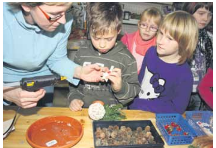
Mit großem Eifer schmückten die Hortkinder aus Lommatzsch die Adventsgestecke.

Mit großem Eifer haben die Kinder die vorgefertigten Gestecke geschmückt und mit weihnachtlichem Dekor versehen. Ob Tannenzapfen, kleine Perlen, Sterne oder Weihnachtsmänner - jedes Gesteck sah am Ende anders aus und war mit Sicherheit eine richtige Überraschung für die Eltern.