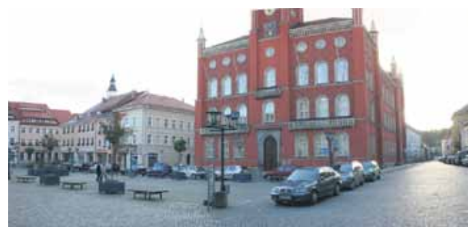
Kamenz lädt zum Shoppen ein.

Insbesondere soll mit dieser Strategie Kaufkraft gebunden werden, die sonst vielleicht in andere Shopping-Zentren abwandert. Wer Kamenz „verschenkt“, unterstützt somit nicht einzelne, sondern den Standort insgesamt, heißt es in einer Presseinformation.