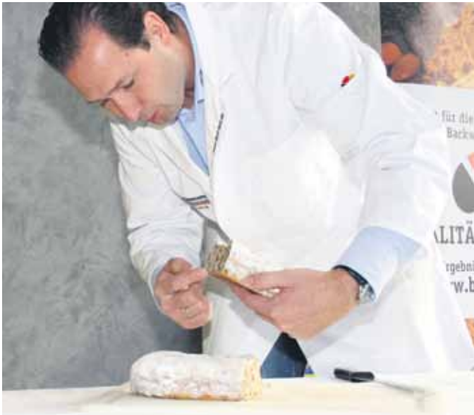
Die Meißner Bäckerinnung hat die Stollen ihrer Mitglieder testen lassen.