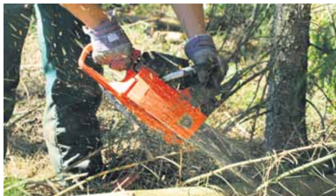
Wer mit Holz heizt, kann sich sein Brennmaterial auch aus dem Wald holen.

Trockenes Holz verbrennt übrigens äußerst umweltfreundlich: Es qualmt kaum, rußt nur gering und heizt außerordentlich gut, so sagen Verbraucherschützer. Ein Raummeter luftgetrocknetes Laubholz, das ist ein locker aufgesetzter Holzstoß von einem Meter Länge, Breite und Höhe, habe den gleichen Heizwert wie 220 Liter Heizöl. Ehe das Holz aber richtig trocken ist, sollte es zwei bis drei Jahre gelagert werden.