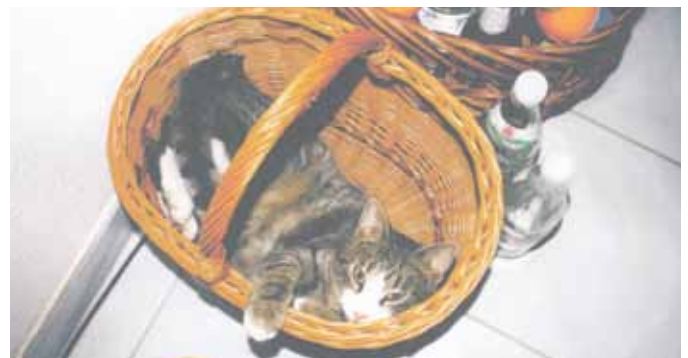
Gretl geht gern auf Schlangenjagd.