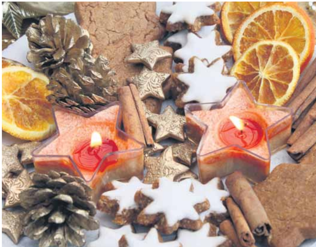
Weihnachtsdekoration stimmt auf die Feiertage ein

Es muss ja auch nicht immer ein richtiger Adventskranz sein, vier verschieden hohe schöne Kerzen mit Tannenzapfen, Äpfeln, Glaskugeln oder Sternen auf einem großen Schmuck-teller arrangiert, wirken sogar sehr stilvoll. Aber auch klassische Adventskränze und sogar kleine Weihnachtsbäumchen lassen sich aus Zweigen von Nadelgehölzen ganz leicht selber binden. Aber dazu brauchen Sie ein klein wenig mehr Zeit.