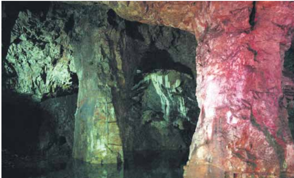
Blick in das alte Bergwerk.