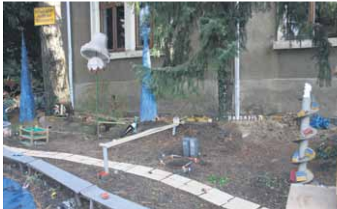
Die Ausstellung im Garten des KUNSThauses Radebeul.

Das Projekt „Baustelle Radebeul“ läuft noch bis zum 30. Dezember 2010 und wird an diesem Tag mit einer Dankesveranstaltung ausklingen. Gleichzeitig eröffnet am 30. Dezember, 19 Uhr, als letzte Veranstaltung im Jubiläumsjahr die Ausstellung „Satt-Kunst-Stadt“ im KUNSThaus Kötzschenbroda.