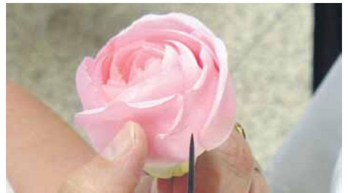
Manufakturen aus Sachsen stellen ihre Produkte vor. Dazu gehören auch Seidenblumen.