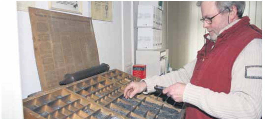
Am Setzkasten werden im Winkelhaken die einzelnen Buchstaben zu Zeilen zusammengefügt.