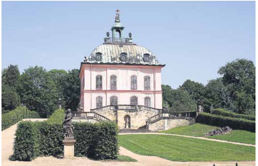
Das Fasanenschlösschen in Moritzburg.

Während das Schloss Moritzburg auch im Winterhalbjahr geöffnet hat, kann das Fasanenschlösschen erst wieder ab Karfreitag, dem 22. April 2011, besichtigt werden.