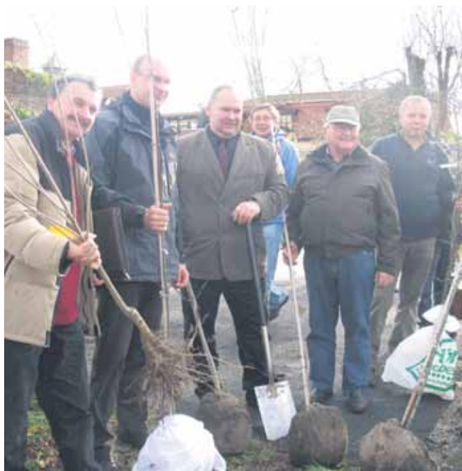
Zum Klimatag in Großenhain wurden auf dem Kupferberg Bäume gepflanzt.

für die ganze Familie wurde hier das Thema Klimawandel näher gebracht.