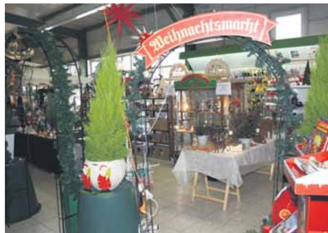
Außerdem gibt es eine reiche Auswahl an dekorativem Weihnachtsschmuck.

kunterbunt geschmückt wird, ist freilich Geschmackssache. Ebenso die Beleuchtung. Echte Kerzen wirken zwar romantisch und festlich, sind aber nicht ganz ungefährlich. Bei der elektrischen Beleuchtung geht der Trend übrigens zu LED-Lampen. Sie verbrauchen weniger Strom.