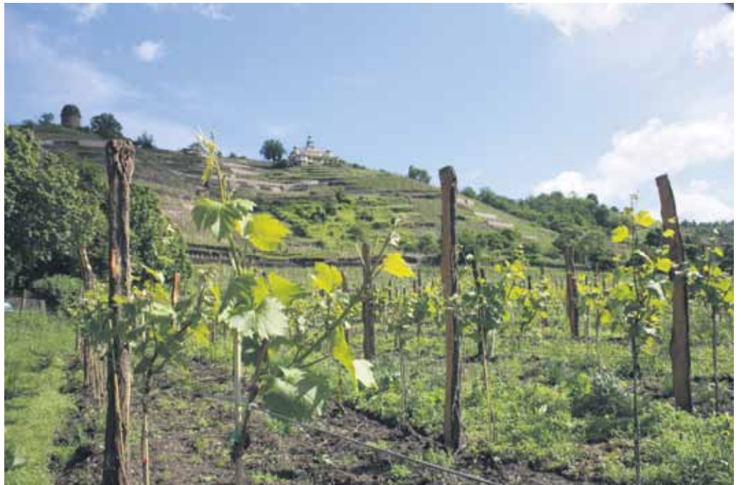
Das Anbauggebiet Goldener Wagen in Radebeul.

gebaut. Zu den Hauptsorten gehören Müller-Thurgau, Riesling und Weißburgunder. Im Hahnemannszentrum Meißen steht übrigens der älteste Rebstock Sachsens. Er soll zwischen 1870 und 1880 gepflanzt worden sein.