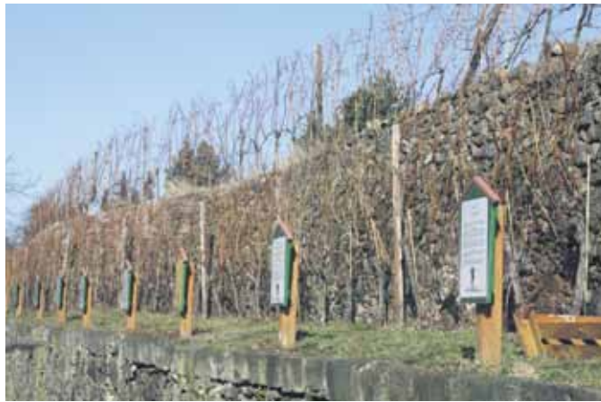
Radebeul verfügt über viele schöne Wanderwege in deren Ausbau investiert wird.

Grundschule Augustusweg über eine neue Gestaltung ihres Schulhofes freuen und die Zitzschewiger Kinder bekommen einen neuen Spielplatz. Auch in den weiteren Ausbau von Wanderwegen wird investiert.