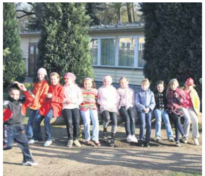
Jeweils vier Wochen können sich 52 Kinder aus Weißrussland im Kinderkurheim Volkersdorf erholen.

Kontakt: (035207) 8 12 84 www.volkersdorf.org