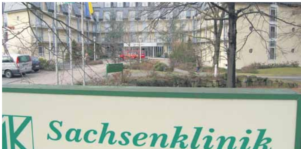
Trägt nicht unwesentlich zum guten Ruf der Kurstadt bei: die Sachsenklinik.