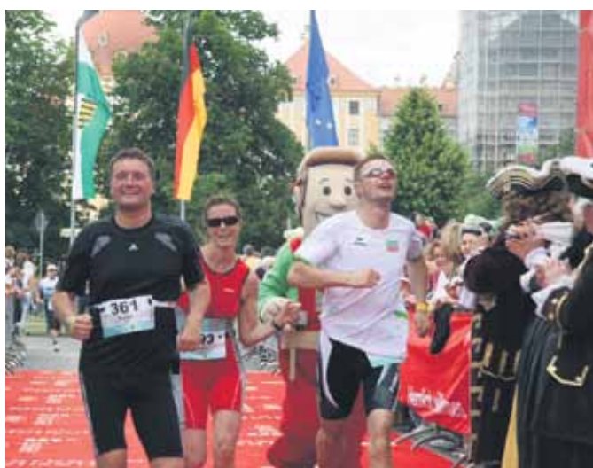
Der Moritzburger Schloss-Triathlon ist zu einem der beliebtesten Wettkämpfe geworden.

Wer sich für ein Training in der LandMAXX-Mannschaft bewerben möchte, schickt bis zum 17. Februar 2011 eine E-Mail an Landpost@landmaxx.de .