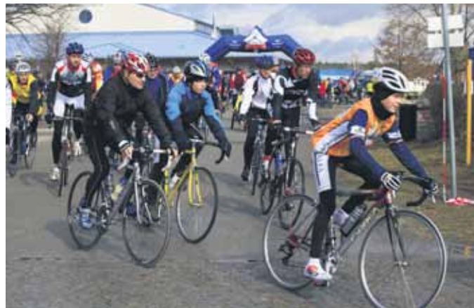
Der Schneeglöckchenlauf fand im vergangenen Jahr großes Interesse.

Für die passende Unterhaltung an der Strecke sorgen der Spielmanszug Ortrand, die Samba-Trommler Los Pepinos aus Cottbus, Cheerleader und weitere Musikanten.