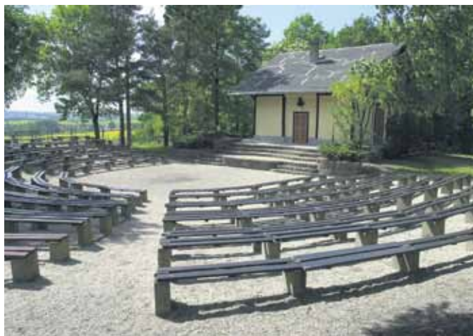
Der Gellertberg in Oberau soll wieder zu einem belebten Veranstaltungsort werden.

Der Gellertberg erhielt seinen Namen nach dem bekannten Dichter Christian Fürchtegott Gellert, der sich 1769 in Oberau aufhielt.