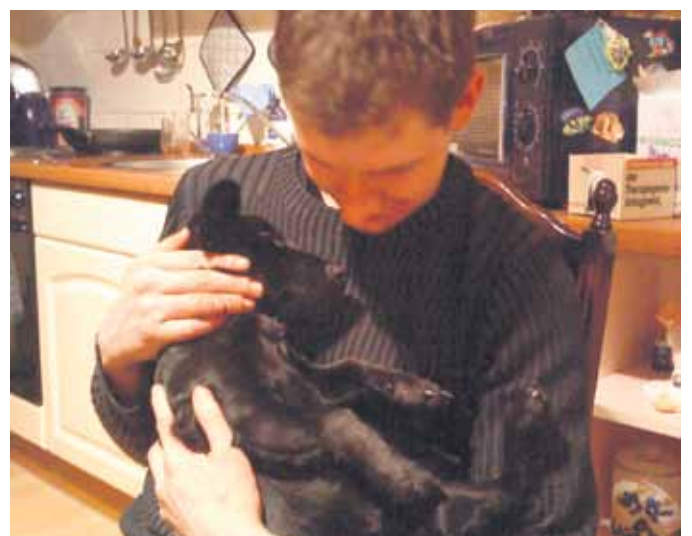
Für Streicheleinheiten ist Teddy immer zu haben.