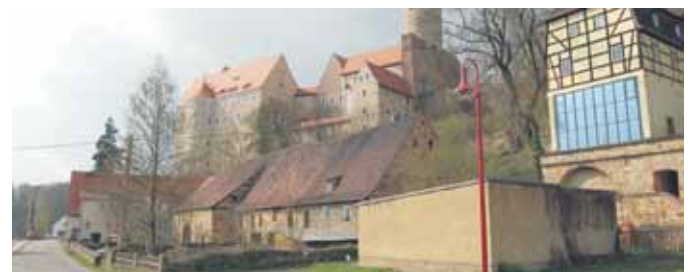
Wieder Baustelle: Burg Gndstein.

Zudem würden die Stützwände zur höher liegenden Terrasse des Pachtbereichs Westflügel der Burg stabilisiert, wo sich das Hotel und Restaurant befinden. Erforderlich seien die Bauarbeiten nach Loslösung von Steinen des eingestürzten Westwehr gewesen, die die Verkehrssicherheit der angrenzenden Straße gefährdeten.