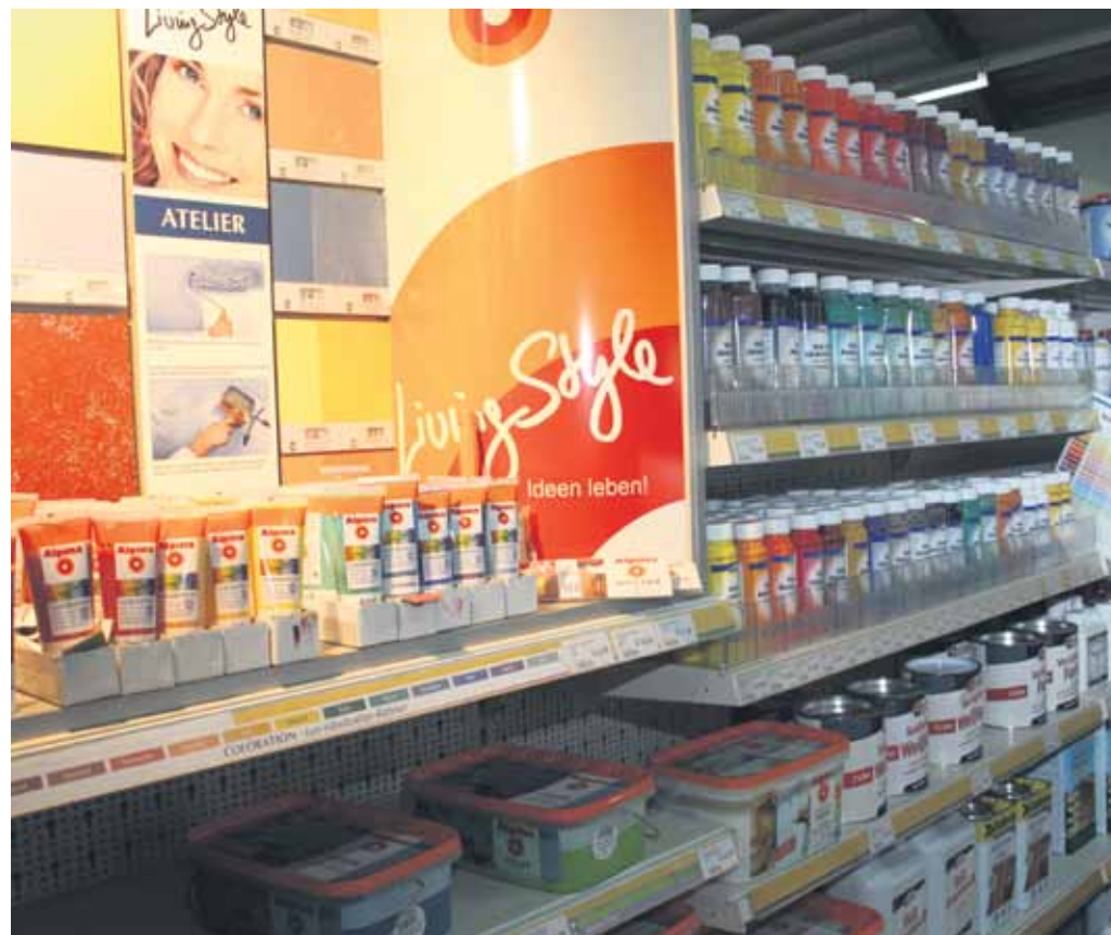
Neben einer breiten Palette vorgemischter Farben gibt es viele Möglichkeiten für einen ganz individuellen Farbton.

LandMAXX. Der Alpina COLORdesigner unterbreitet Ihnen eine Auswahl passender Farbharmonien, mit denen Sie Wände, Decken und Möbel einfärben können. Mit oder ohne trendige Struktureffekte. Lassen Sie Ihrer Kreativität freien Lauf. Hier finden Sie den COLORdesigner bei Alpina. Einfach unter www.landmaxx.de Dienstleistungen und dann Farbberatung anklicken.