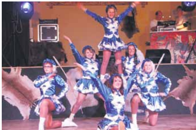
Die großen Funken des NKC.

so dass man schon von weitem hören kann: „He, Jo, He, NKC!“.