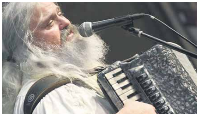
Der „Squeeze Box Teddy“ interpretiert Folksongs.

kannter und beliebter Lieder aus allen Bereichen der Folkmusik.