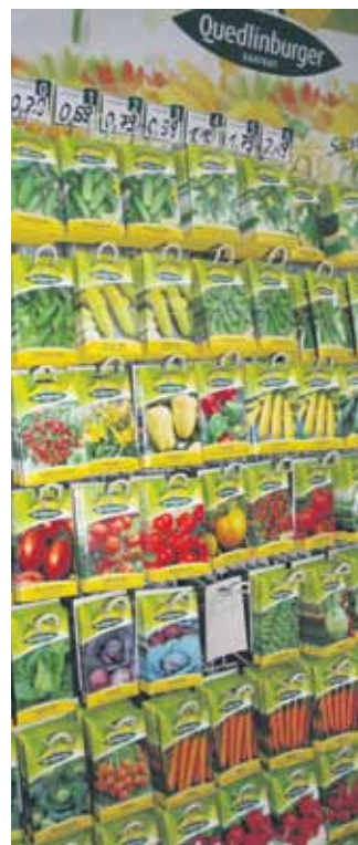
Eine breite Auswahl an Saaten gibt es in den LandMAXX-Märkten

Wie kein anderes Nahrungsmittel versorgen uns Hülsenfrüchte mit wertvollem pflanzlichen Eiweiß, mit Mineralstoffen und Vitaminen. Außerdem enthalten sie reichlich Ballaststoffe. Hülsenfrüchte gehören zu den Lebensmitteln mit großer Nährstoff-, aber geringer Energiedichte.