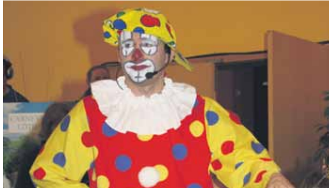
Beim Kinderfasching darf der Clown natürlich nicht fehlen.

bereichern das ganze Jahr über das kulturelle Leben in der Gemeinde Löthain.