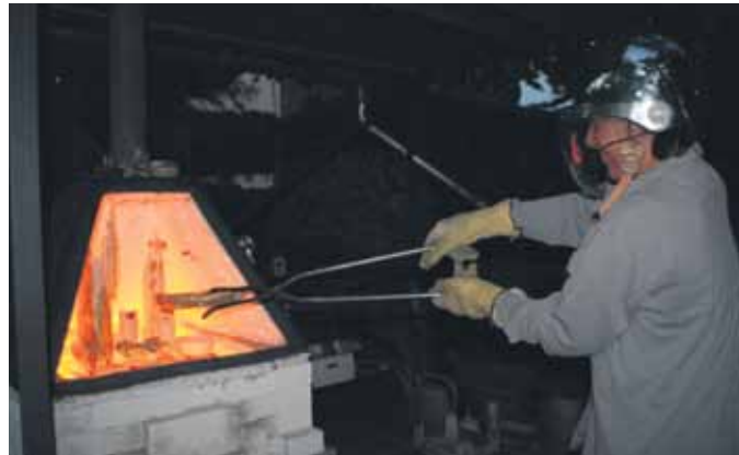
In einer Brenntechnik aus Japan hergestellte Keramik ist derzeit im Museum Coswig zu sehen.

Die Ausstellung ist Dienstag, Donnerstag, Sonnabend und Sonntag von 14 bis 18 Uhr geöffnet.