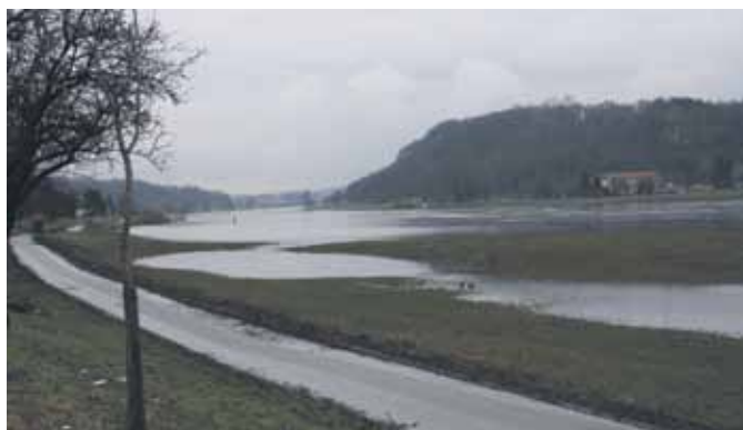
Langsam zieht sich die Elbe wieder zurück.

Mit dem Rückgang des Wassers begann das große Aufräumen. Vor allem die Elbe sorgte für massenweise Schwemmgut, welches beseitigt werden musste.