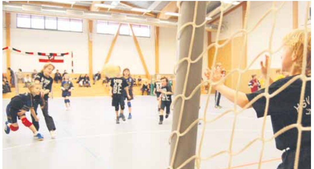
Nachwuchsarbeit wird groß geschrieben: Im Rahmen des jüngsten Weihnachtspyramiden-Turniers traten Hobby-Teams gegeneinander an.

stehen die Zeichen bei der weiblichen A-Jugend in der Bezirksliga.