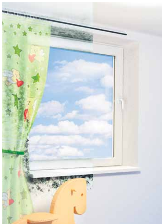
Eine richtige Lüftung kann Schimmel vermeiden.

Durch die heutigen bautechnischen Möglichkeiten, bei denen, durch Abdichten und Dämmen von Gebäuden, viel Heizenergie gespart werden kann, entsteht nämlich eine unerwünschte Nebenwirkung: Dichte Häuser sind prinzipiell schlechter durchlüftet und so reichen kleine (schwer erkennbare) Schwachstellen in der Wärmedämmung, um die Schimmelpilzbildung zu begünstigen. Schlafzimmer, Badezimmer und Küchen sind hier besonders gefährdete Bereiche, denn in diesen Räumen entsteht - rein nutzungsbedingt - eine höhere Raumluftfeuchtigkeit, bei seltenerer Beheizung.