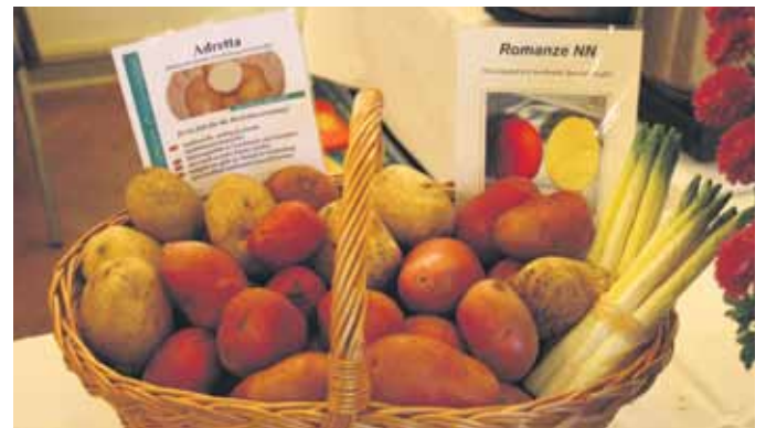
Das Online-Verzeichnis soll auch darüber Auskunft geben, wo man frisches Obst und Gemüse bekommt.

Mit dem Online-Verzeichnis erlangen Produzenten und Händler Zugang zu einem Vertriebsgebiet, dass vom Leipziger Land bis nach Bautzen reicht. Die kostenfreie Registrierung ist noch möglich. Unter www.region.dresden.de/regionalprodukte können die Unternehmensdaten und Angebote selbst eingegeben und gepflegt werden.