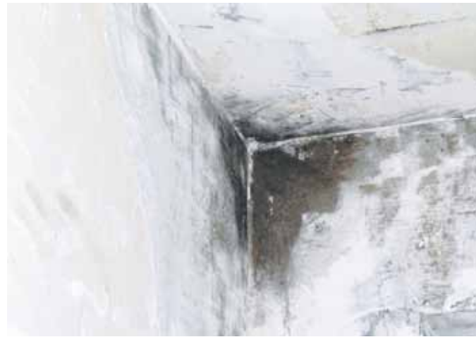
Schimmel sieht nur nicht schlimm aus, sondern kann auch gesundheitsschädlich sein

SchimmelX und in Wohn- und Schlafbereichen mit chlorfreien SchimmelX-Produkten. Und: Die Systemprodukte von SchimmelX zeichnen sich durch eine innovative Anti-Schimmel Technologie aus, die gleichzeitig anwenderfreundliche Verarbeitungsqualität gewährleistet.