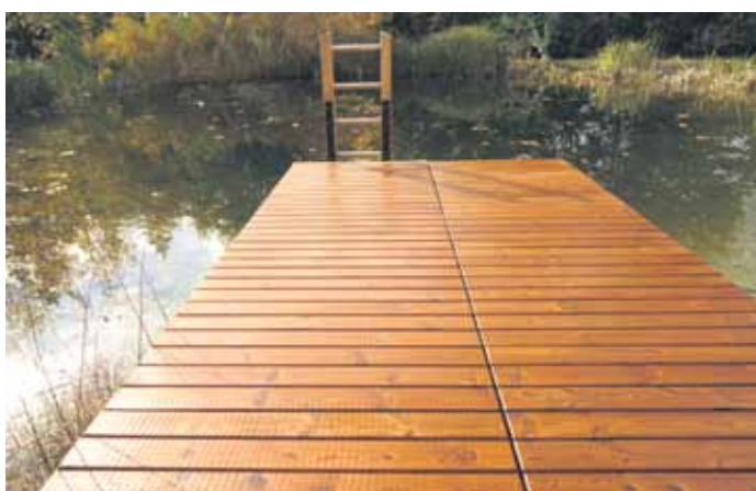
Gartenholz gliedert sich harmonisch in die Natur ein.