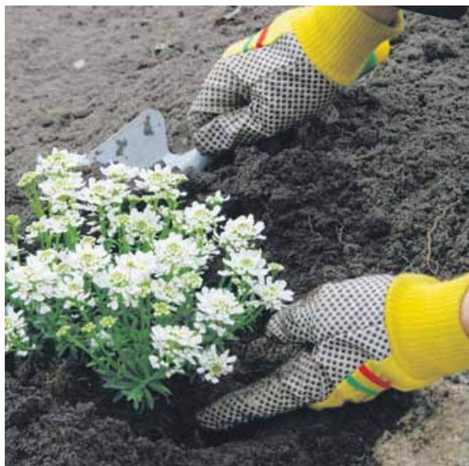
Im März kommen auch die ersten Stauden ins Beet.

Wicken sind zum Beispiel wenig frostempfindlich und können ab Mitte März direkt ins Beet gesät werden.