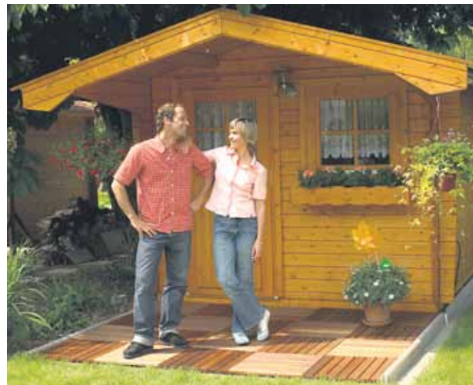
Nach einer Behandlung mit der richtigen Deckschicht-Lasur kann man den Pinsel getrost für bis zu sieben Jahre bei Seite legen.