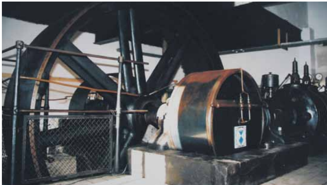
Die restaurierte Dampfmaschine.

falls restaurierten Kolben-dampfmaschine ist etwas ganz Besonderes.