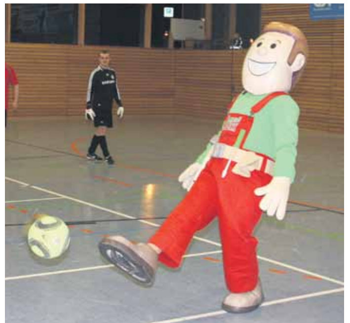
Auch der LandMAXX kickte mit.