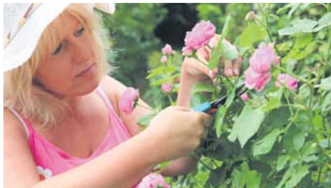
Im März sollten die Strauchrosen verschnitten werden.