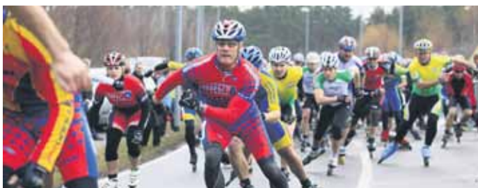
Auch in diesem Jahr werden wieder zahlreiche Teilnehmer erwartet.