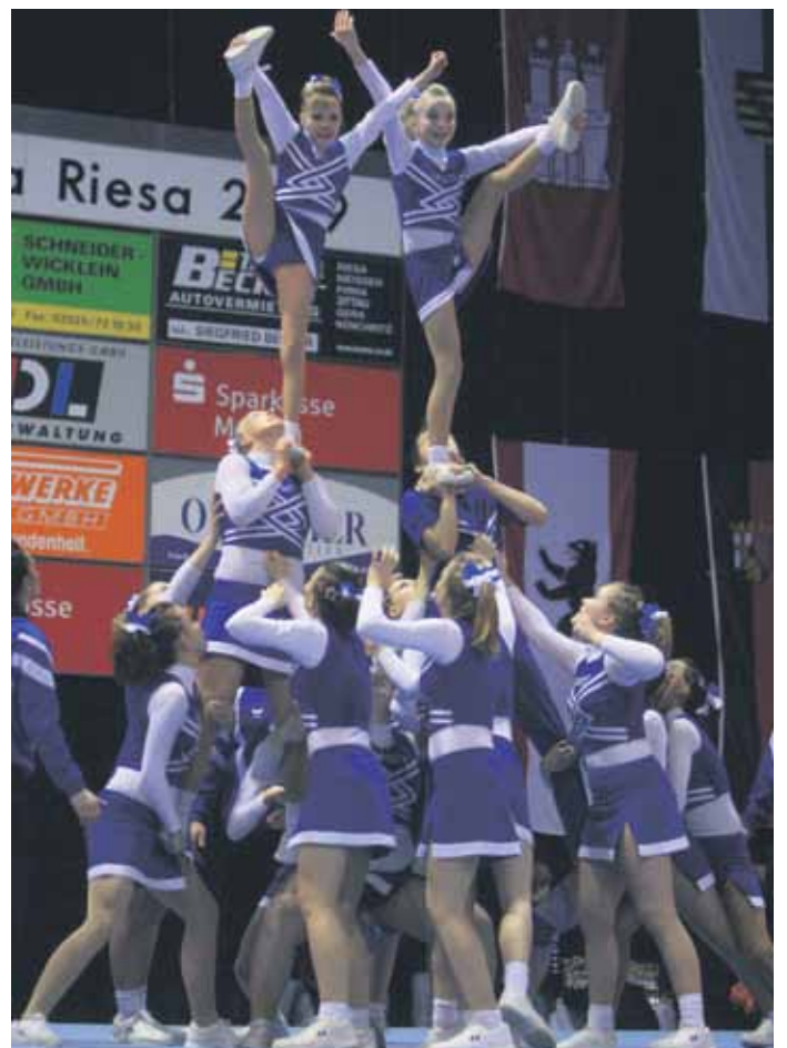
Cheerleader begeistern bei der Meisterschaft in Riesa.