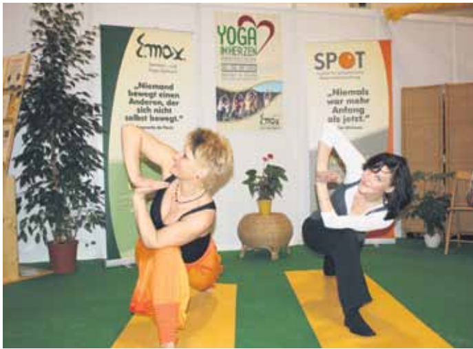
Die Messe aktiv+vital lädt zum Erleben und Mitmachen ein.