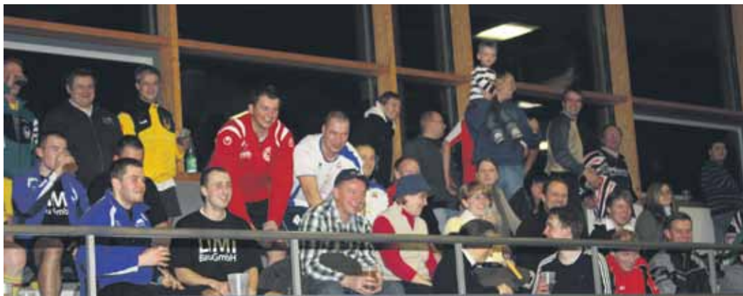
Viele Zuschauer feuerten die Teams lautstark an.

Obwohl der Gastgeber alkoholfreie Getränke, Bier und Bockwurst gesponsert hat, griffen viele Sportler ins Portemonnaie und füllten die Spendenbox. Über 200 Euro kamen so zusammen. Der Erlös kommt dem Kinderkurheim in Volkersdorf zugute, wo sich Mädchen und Jungen aus der Region um Tschernobyl erholen.