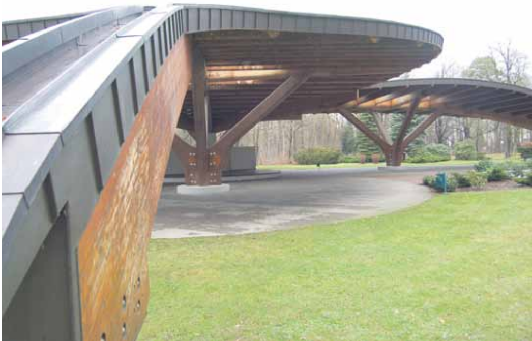
Ein Stück Kurgeschichte: Wo heute der „Schmetterling“ steht, befand sich das erste Badehaus.

Konzert gestalten, zu dem der kurstädtische Geschichtsverein einen Exkurs in die Bade-Historie beisteuern wird. Und damit genau an jener Stelle der Kurstadt, an der Gottlieb Friedrich Herrmann das erste Badehaus erbaut hatte und 1821 seine ersten Gäste empfing. In einer vom Verein im Kur- und Stadtmuseum geplanten Sonderschau sollen zudem 190 Jahre Kurgeschichte in Dokumenten und Bildern anschaulich gemacht werden.