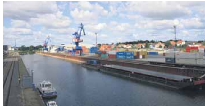
Im Riesaer Hafen wurde der Güterumschlag erneut gesteigert.

Für den Ausbau des Dienstleistungsangebotes investierte der Hafenverbund 2010 in zwei wichtige Projekte: Neben der Eisenbahnbrücke über die Zufahrt zum Alberthafen Dresden gehörte dazu die Eröffnung der 16 000 m 2 großen Logistikhalle für die Firma Goodyear Dunlop Tires Germany in Riesa. Der Hafen als trimodales Terminal bietet eine verkehrsgünstige Anbindung, sodass Transportketten für die Beschaffung von Rohmaterial sowie die Auslieferung von Fertigprodukten per Binnenschiff, Bahn und Lkw angeboten werden können.