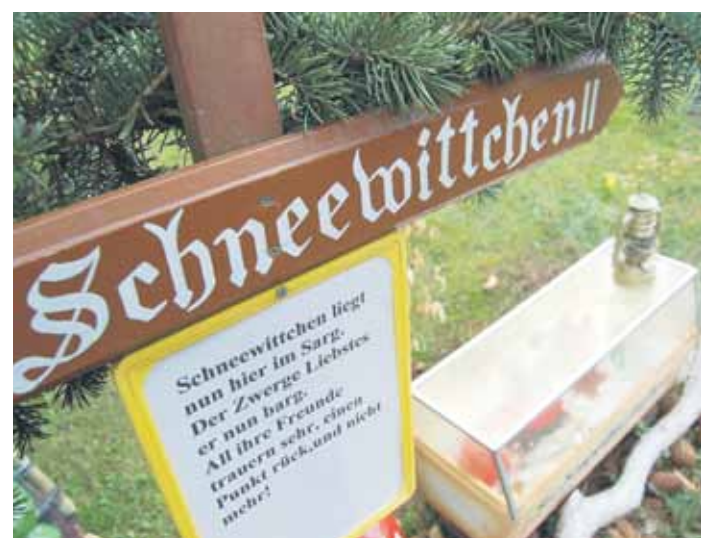
Saisonstart: Der Miniaturen- und Märchengarten in Gnandstein öffnet in wenigen Tagen seine Pforten.