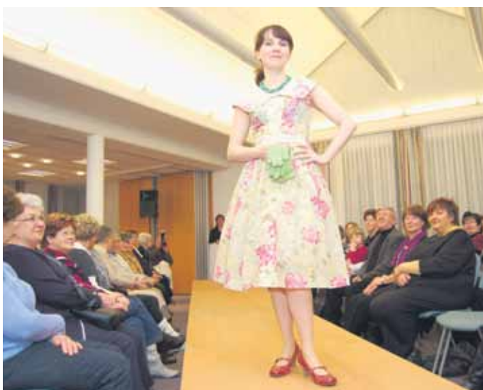
Hobby-Models präsentierten anlässlich der Ausstellungseröffnung Kleider aus 40 Jahren DDR-Modegeschichte.