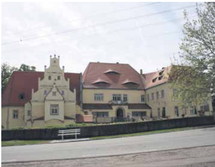
Das Schloss Schleinitz gehört zu den schönsten Schlössern im Elbland.