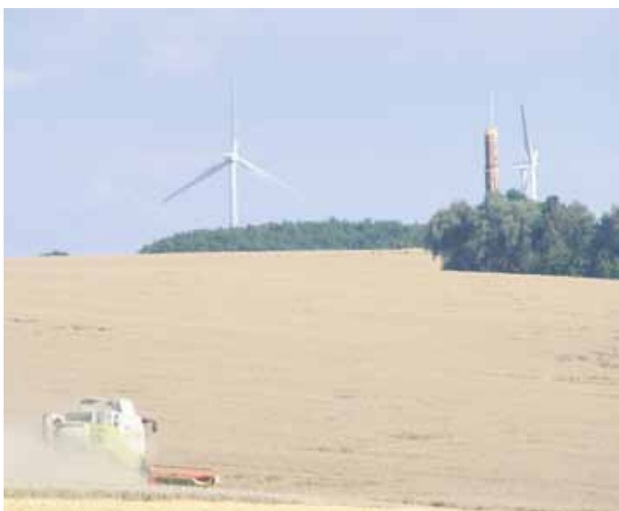
Der sanierte Aussichtsturm in Striegistal.

Der schon von Weitem zu sehende Turm ist über neugestaltete, befestigte Wege von Böhrigen und von Etzdorf aus erreichbar.