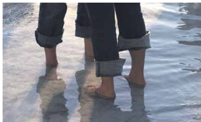
Ganz im Sinne von Kneipp: Wassertreten.