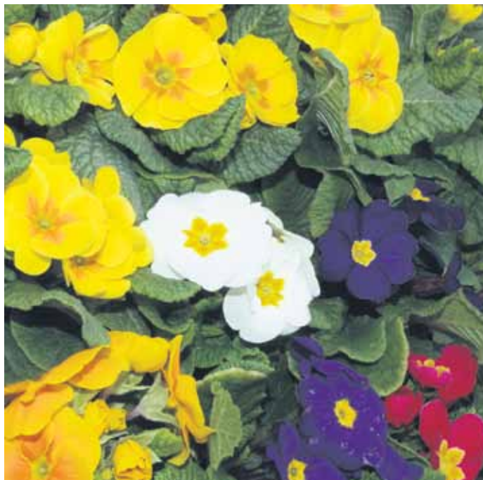
Primeln bringen den Frühling in Heim und Garten.

freudigen Sträucher die Farbe des Frühlings auch auf Balkon und Terrasse.