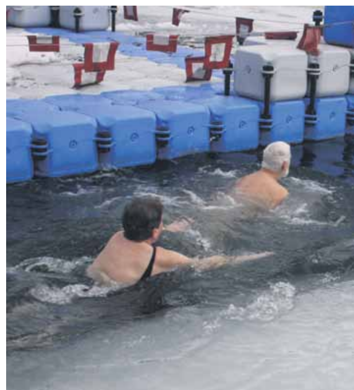
Eine lange Tradition hat das Winterschwimmen.

Alle Veranstaltungen stehen natürlich auch Nichtmitgliedern offen.