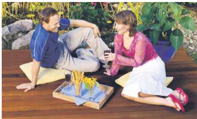
Mit dem richtigen Schutz vor Sonne und Witterung hat man lange Freude an Hölzern im Garten. Ob Lasur oder Öl, ob mit oder ohne Grundierung wissen beispielsweise die Fachberater im LandMAXX-Markt.

die Holzoberflächen wieder wie neu und sind das ganze Jahr sicher vor Vergrauen geschützt. Je nach Verwitterungszustand sind ein oder zwei Anstriche mit dem milden Pflegemittel nötig. Einfach sparsam mit einem weichen Flachpinsel auftragen, fertig. Nachträgliches Polieren ist nicht nötig.