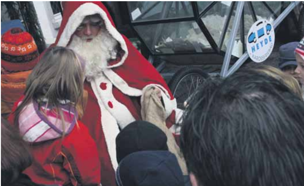
An den Adventstagen kommt der Weihnachtsmann.

gebirgische Volkskunst u.v.a.m. Lose für nur 2,00 Euro können in Meißen u.a. bei der Sparkasse, bei Brück & Sohn, bei der City-Blume, am Busbahnhof im Infozentrum der Verkehrsgesellschaft Meißen und der Sächsischen Zeitung erworben werden. Der Reinerlös der Lotterie geht an drei gemeinnützige Vereine.