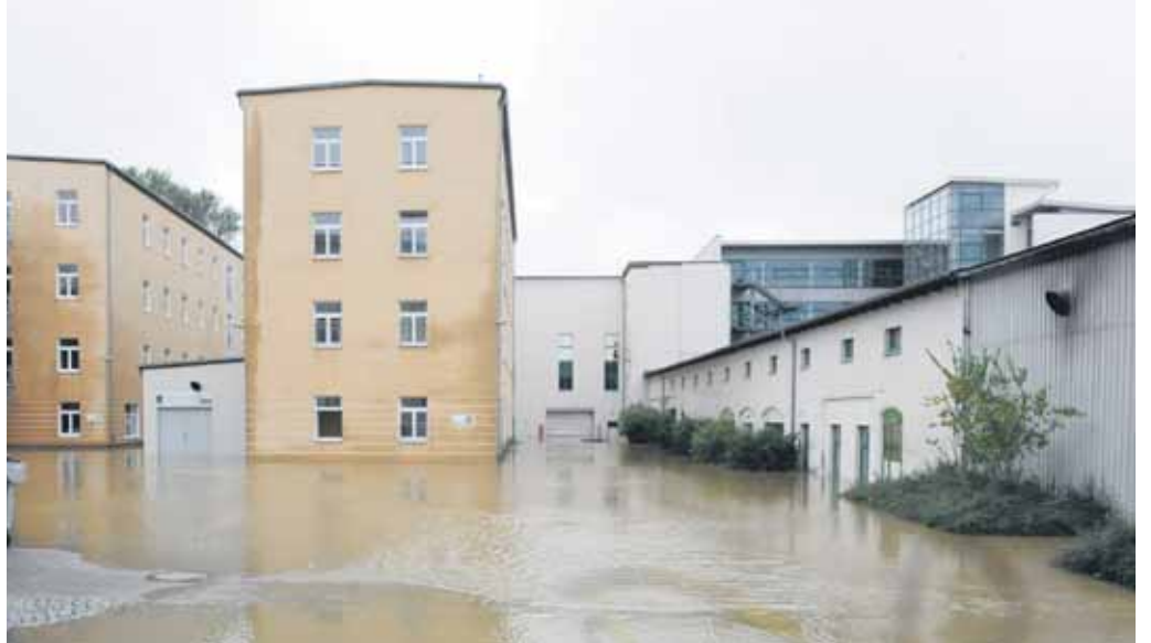
In Großraschütz bei Großenhain standen mehrere Gebäude unter Wasser.

Katastrophenalarm gab es auch in Südbrandenburg. So wurde in Elsterwerda vorsorglich das Gymnasium evakuiert. Am Tag darauf, waren alle Schulen geschlossen. Die Patienten eines Krankenhauses mussten sicherheitshalber mit Rettungsfahrzeugen und Hubschraubern in andere Einrichtungen verlegt werden.