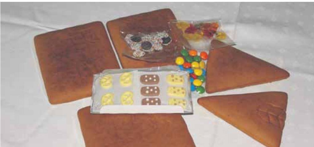
Aus den Einzelteilen lässt sich schnell das Pfefferkuchenhaus zusammen bauen.