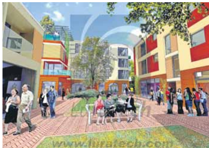
So sollen die Sidonienhöfe aussehen.