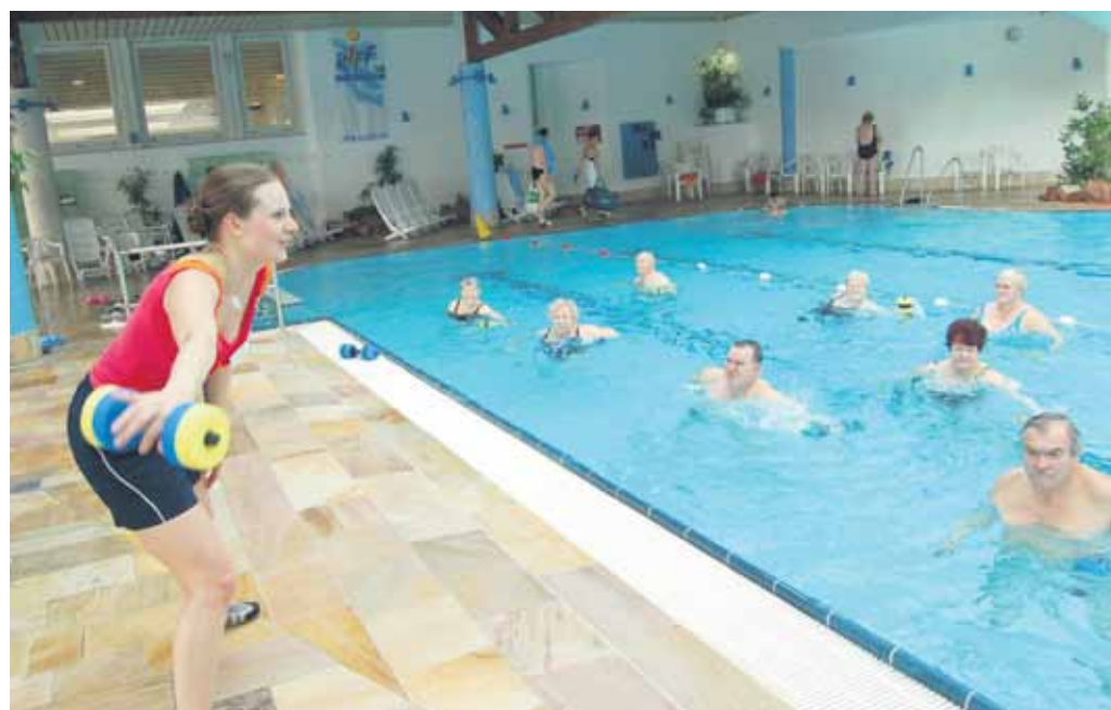
Aquagymnastik: Im Riff kommen alle Generationen auf ihre Kosten.