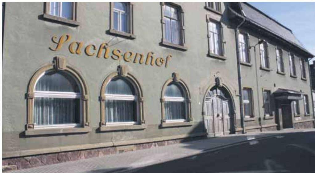
Der Sachsenhof in Nossen soll wieder zu einem Kulturzentrum werden.

Bei der Rekonstruktion gilt dem Denkmalschutz großes Augenmerk. So geht es im Saal zum Beispiel um den Erhalt des prächtigen Stucks, der Emporen, des Geländers und der Treppen. Im Erdgeschoss sollen Wandmalereien mit Ornamenten und originale Holzeinbauten in Räumen bewahrt werden. Viele Holztüren stammen noch aus dem 19. Jahrhundert. Die Sanierung wird in drei Abschnitten durchgeführt.