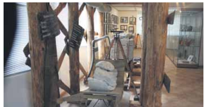
In den Museumsräumen sind die Arbeitsgeräte der Bergleute ausgestellt.