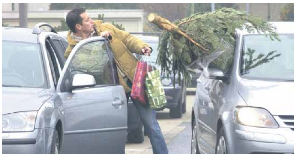
Beim Transport darf der Baum nicht seitlich überstehen.

netem Deckel im Kofferraum mitfährt, sollte er gut gesichert sein. Kennzeichen, Blinker, Brems- und Rücklichter dürfen nicht verdeckt werden.