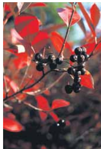
Ein wenig bekannter Star im Herbstgarten: die Apfelbeere.

Der Aroniabeere wird nicht nur eine heilende Wirkung in allgemeiner Sicht auf den Organismus nachgesagt, sie ist auch schmackhaft. Ihre Früchte können zu leckeren Marmeladen und Gelees, Fruchtsoßen und Likören verarbeitet werden. Mittlerweile gibt es auch viele Rezepte, nach denen man die Beeren verarbeiten kann. Zwei sollen für die Leser der Landpost vorgestellt werden.