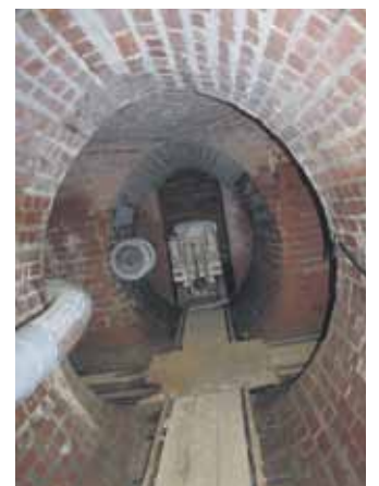
Blick in den Schaustollen.

Das Museum wird heute von den Seilitzer Kaolin- und Tonwerken betrieben und hat derzeit nur auf Anmeldung geöffnet. Wer sich vor Ort anschauen möchte, kann sich unter (03521) 40 25 47 anmelden.