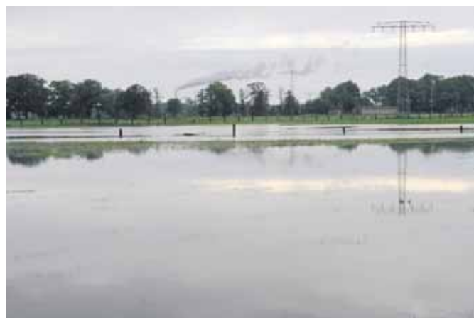
Land unter hieß es Ende September im Elbland. Das Hochwasser führte zu zahlreichen Schäden, an deren Beseitigung heute noch gearbeitet wird.

von Weiden gerettet werden. Viele Grundstücke waren nur noch mit dem Schlauchboot zu erreichen.