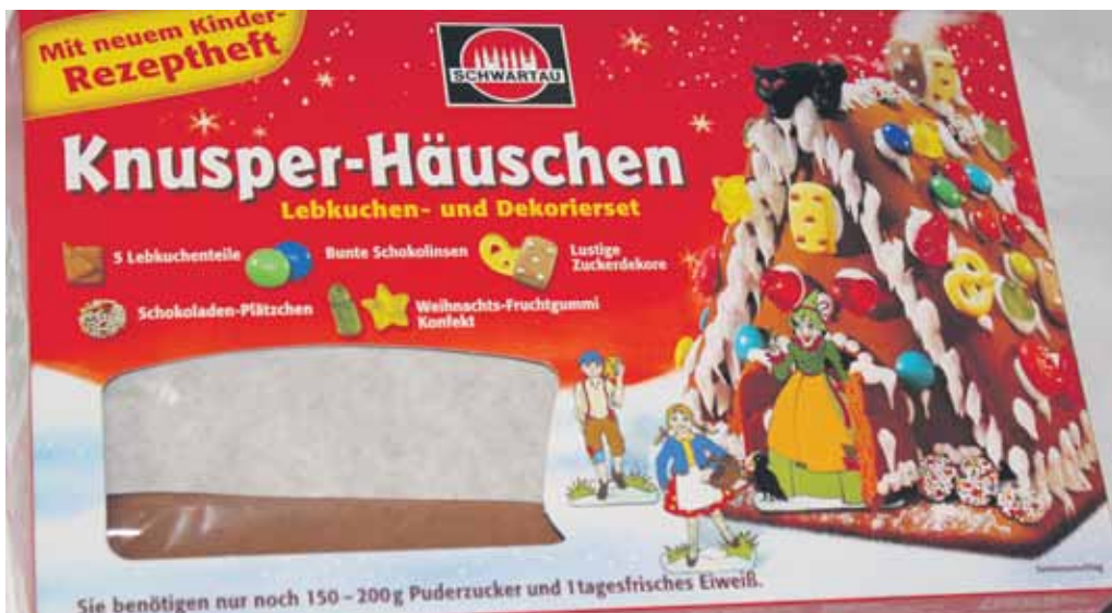
Das Bastelset ist in allen LandMAXX-Märkten erhältlich.