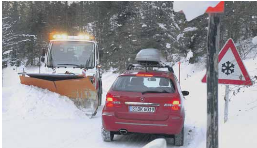
Wer sein Fahrzeug rechtzeitig winterfest macht, kommt sicher durch die kalte Jahreszeit.

Darüber hinaus empfiehlt der ADAC im Winter einen Eiskratzer, Handschuhe, eine Abdeckfolie für die Windschutzscheibe, einen Türschloss-Enteiser, eine warme Decke und ausreichend Flüssigkeit bei einer längeren Reise mit an Bord zu haben.