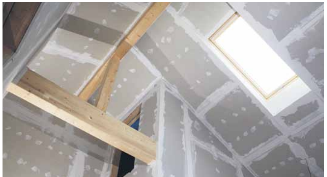
Mit Trockenbau lassen sich neue und optimale Raumaufteilungen herstellen.

Mit dem Trockenbau gibt es heute vielfältige Gestaltungsmöglichkeiten, die eine optimale räumliche Aufteilung gewährleisten.