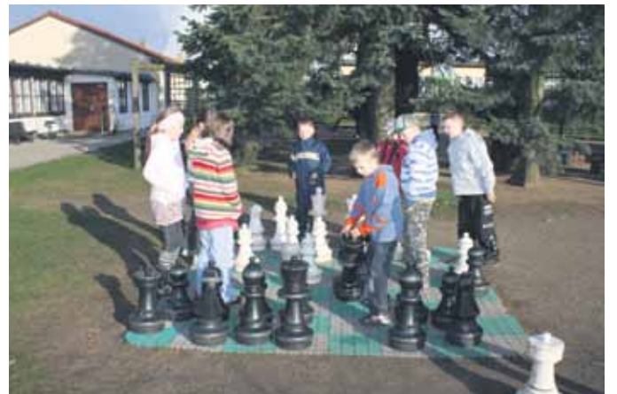
Jeweils vier Wochen können sich 52 Kinder aus Weißrussland im Kinderkurheim Volkersdorf erholen.