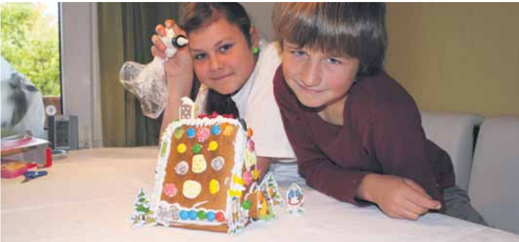
Wie im Märchen – das Pfefferkuchenhaus von Hänsel und Gretel.

wenig Geschick lässt sich aus den Einzelteilen ein schmuckes Häuschen bauen. Mit Zuckerguss werden die Lebkuchenteile zusammengefügt und mit Puderzucker, Zuckerdekore, Fruchtgummi und Schokoplätzchen verziert. Es ist nicht nur schön anzusehen, sondern auch eine süße Verführung - so wie bei Hänsel und Gretel.