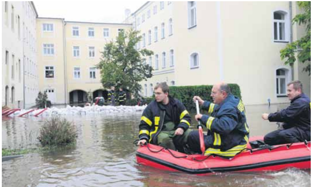
Feuerwehrlaute aus Riesa-Gröbern auf Kontrollfahrt im Rödereck in Großenhain. Auch hier standen Grundstücke unter Wasser.