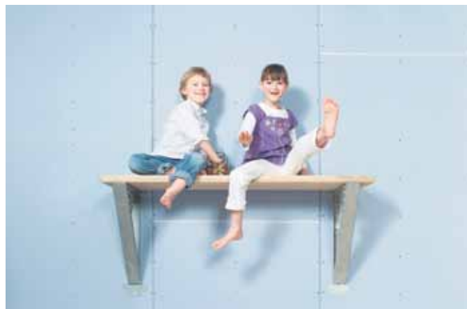
Trockenbauplatten sind vielfältig verwendbar und vor allem belastbar.

Für viele Bauherren ist Trockenbau der Einsatz von Gipskartonplatten. Moderner Trockenbau kennt jedoch noch zahlreiche andere Materialien – wie zum Beispiel zementgebundene Platten. Diese können verputzt werden und sind ohne weiteres im witterungsabhängigen Außenbereich einsetzbar.