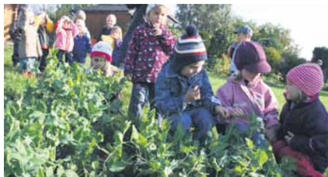
Neugierig nehmen die Kinder den Garten in Augenschein.

von der Gesellschaft Soziales & Umwelt. Und sollten die kleinen Gärtner einmal vom Regen überrascht werden, dann finden sie in der kleinen Gartenlaube Unterschlupf.