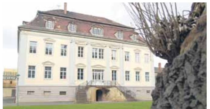
Das Herrenhaus ist Domizil des Ortschaftsrates, der Feuerwehr und des Maifestvereins.

der 1968 endenden Dorfchronik darstellen. „Wir haben dafür bereits in diesem Jahr intensiv im Stadtarchiv Borna recherchiert“, so Friese, dem zufolge Ende dieses, Anfang nächsten Jahres der neue Plan des Vereins fertig sein soll. Im Auge behalten wollen die Vereinsmitglieder auch 2011 die Restaurierung der zurzeit eingelagerten Kuppel des 2006 eingestürzten Torturms, des Steinbacher Wahrzeichens. „Da wir sie nur an ihrem endgültigen Platz restaurieren können, müssen wir diesen Standort aber erst finden“, so der Vereinsvorsitzende.