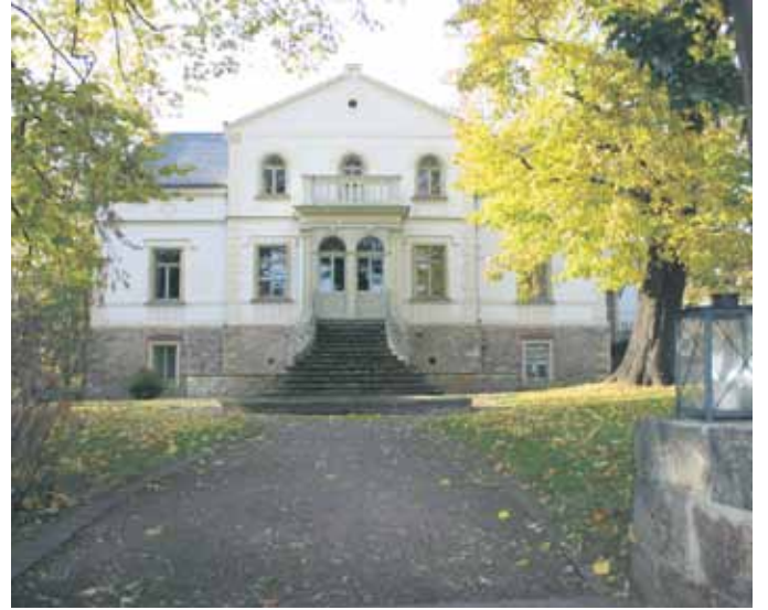
Die Villa Teresa im Coswiger Ortsteil Kötitz.